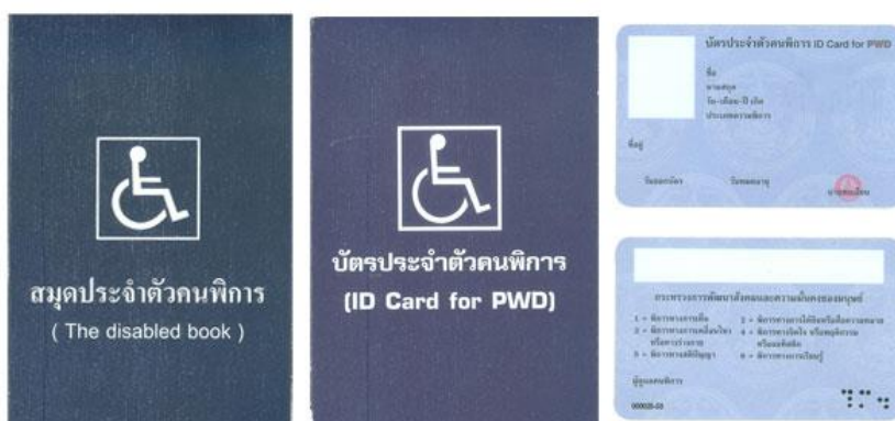
ตัวอย่างบัตรและสมุดประจำตัวคนพิการ

ในการยื่นคำขอลงทะเบียนรับเงินเบี้ยความพิการ คนพิการหรือผู้ดูแลคนพิการจะต้องแสดงความประสงค์ขอรับเงินเบี้ยความพิการโดยโอนเงินเข้าบัญชีเงินฝากธนาคารในนามคนพิการหรือผู้ดูแลคนพิการ ผู้แทนโดยชอบธรรม ผู้พิทักษ์ ผู้อนุบาลแล้วแต่กรณี